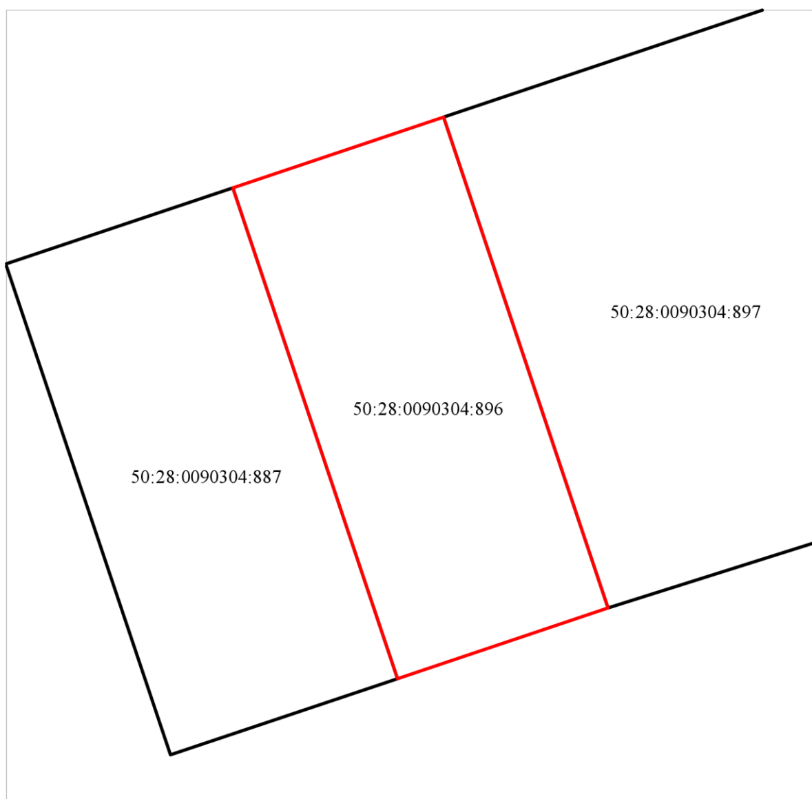
Схема расположения земельного участка в окружении смежно расположенных земельных участков (Ситуационный план)